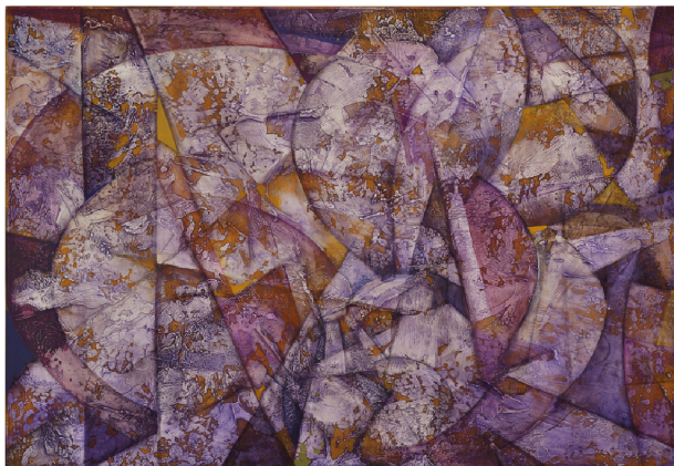
五十里 雅子 Ikari Masako 《Laminando》2025 パネルに和紙貼り油彩 1620×1120mm

今展は 1996 年ギャラリー秀 (鎌倉) の初回展以来 10 年毎、四度目の二人展となります。F200 号の大作から小品までの抽象画、約 20 点を展示します。