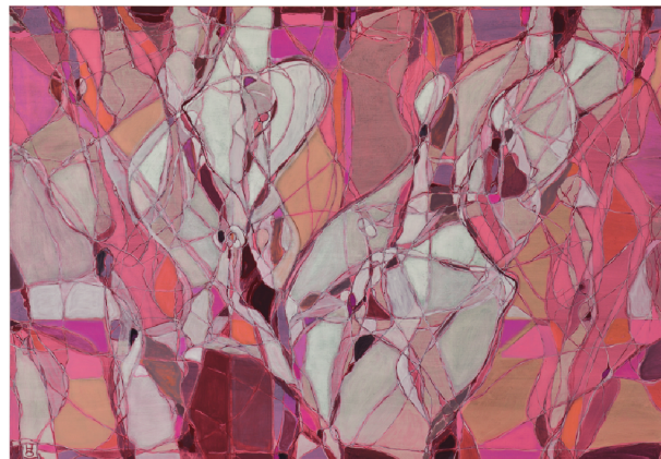
大久保 宏美 Oohkubo Hiromi 《ドルチェ》2025 キャンパスに油彩 1620×1120mm