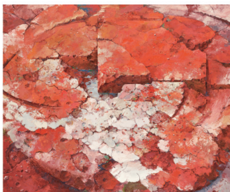
独立賞 山下 智樹