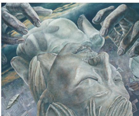
独立賞 千葉 光