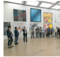
ギャラリートーク